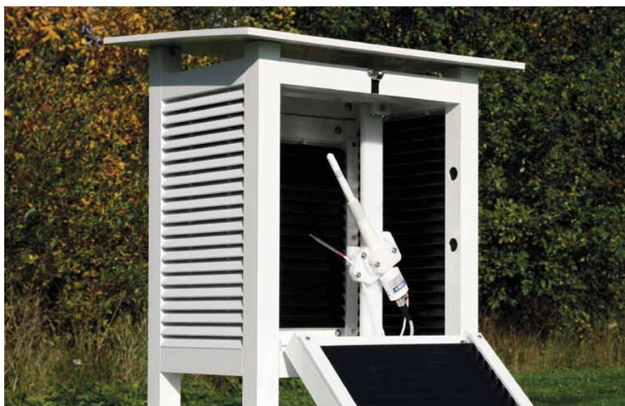
HMP155 mit zusätzl. Temperatursonde und optionalem Stevenson-Montagesatz

Die Vaisala HUMICAP® Feuchte- und Temperatursonde HMP155 gewährleistet zuverlässige Feuchte- und Temperaturmessungen. Sie wurde speziell für anspruchsvolle Anwendungen im Außenbereich entwickelt.