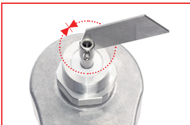
Rotation um 360° Grad mit Drehrichtungswechsel